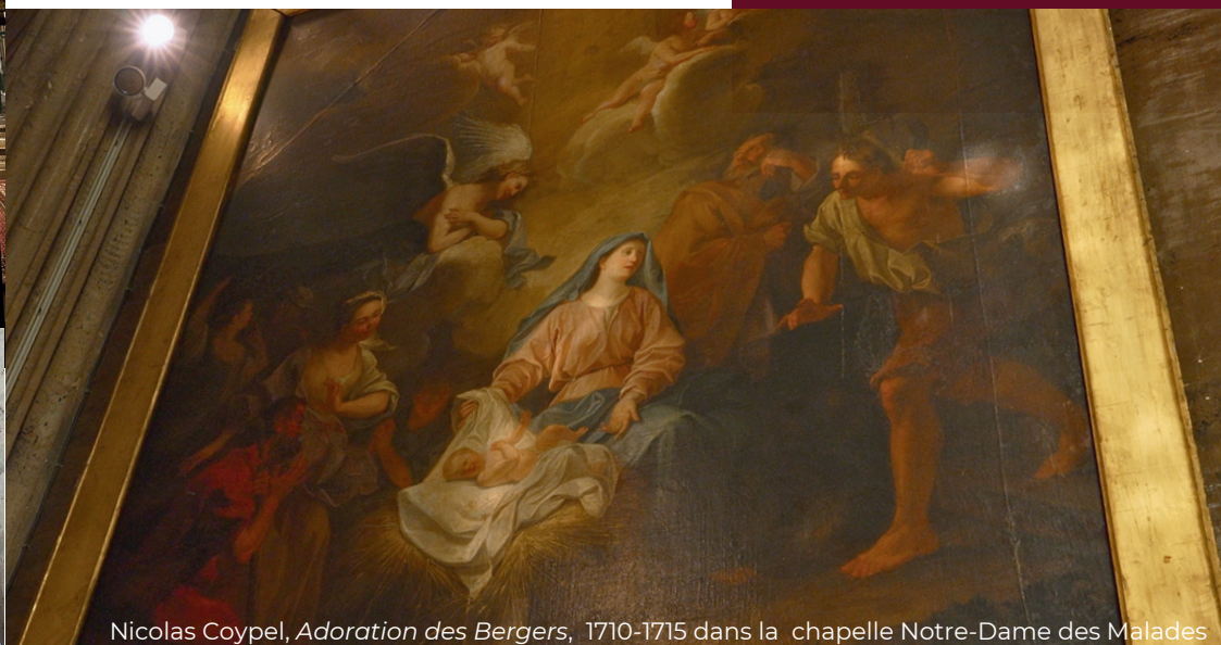
Nicolas Coypel, Adoration des Bergers , 1710-1715 dans la chapelle Notre-Dame des Malades